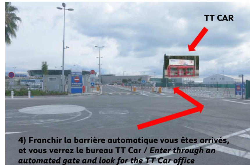
4) Franchir la barrière automatique vous êtes arrivés, et vous verrez le bureau TT Car / Enter through an automated gate and look for the TT Car office