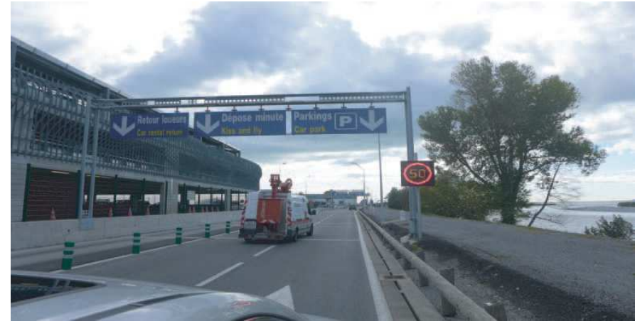
2) Suivre Parkings restez sur la droite / Follow Parking keep right