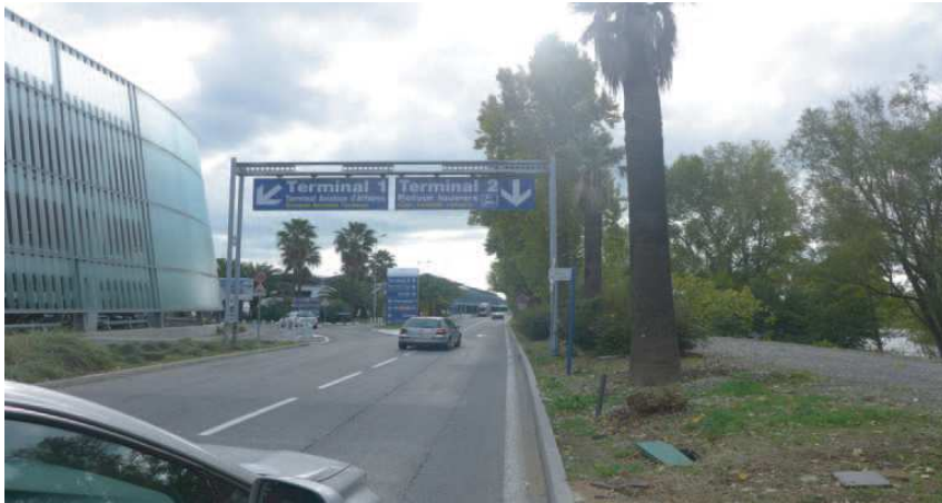
1) Aéroport de Nice Cote D'azur direction Terminal 2 / Nice Airport Azure direction terminal 2