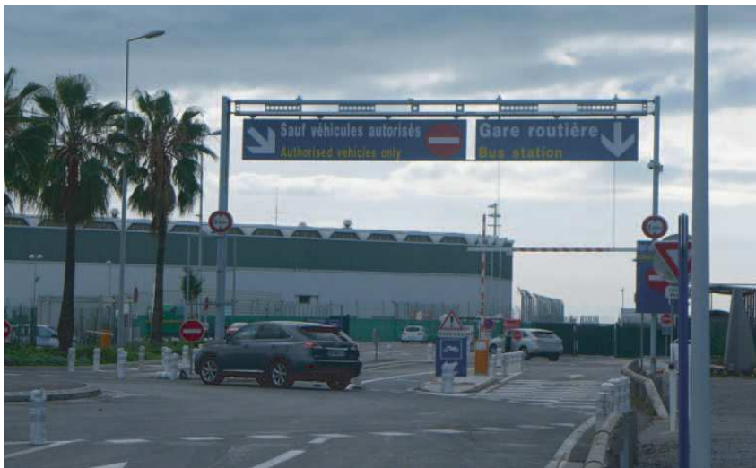
3) Suivre la direction Gare routière / Enter the restricted area "Bus station"